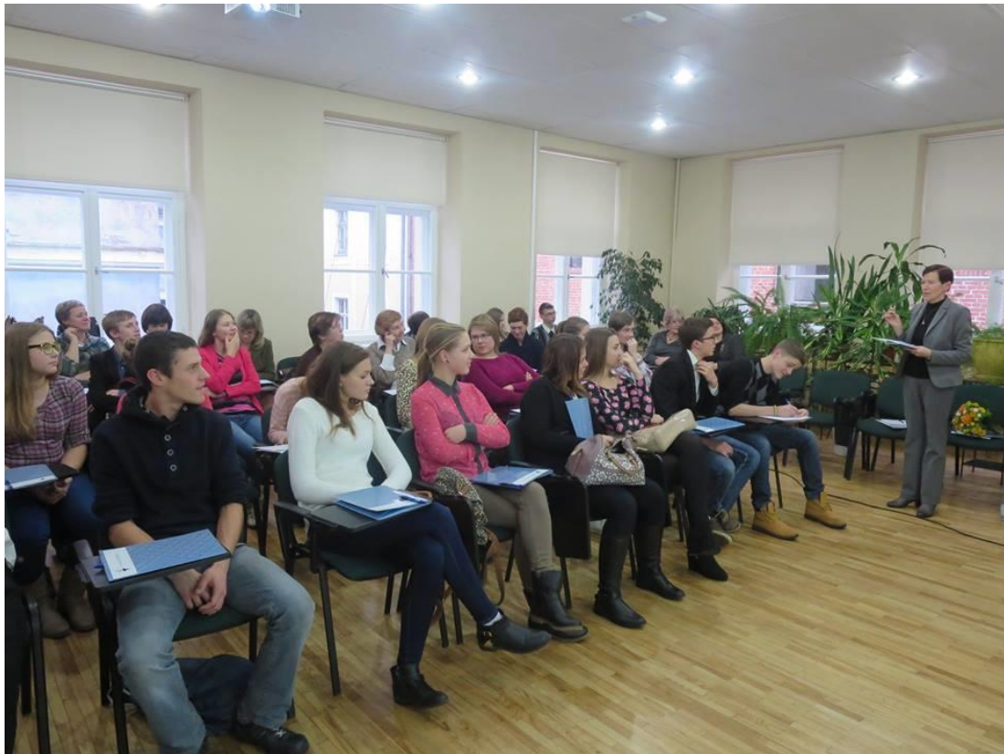
Konferences dalībniekiem bija iespēja arī apmeklēt Latvijas Nacionālo bibliotēku.