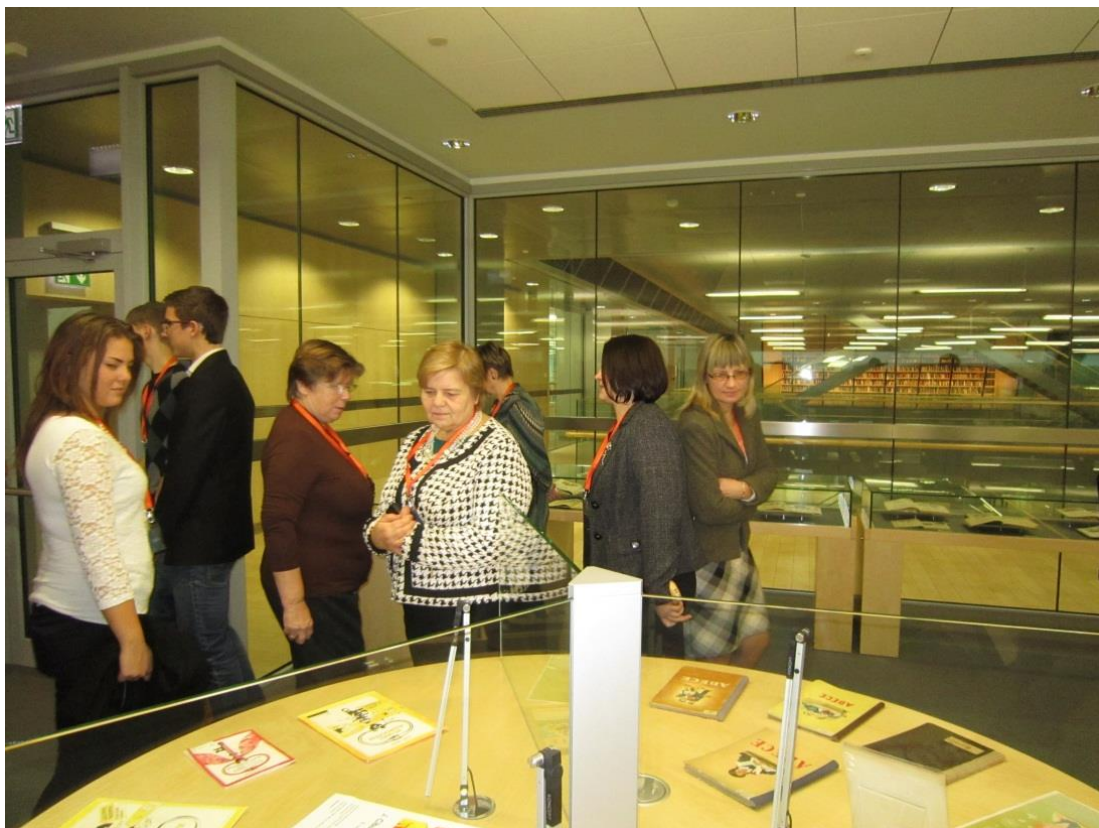
Velga Kakse Baltijas jūras projekta nacionālā koordinatore