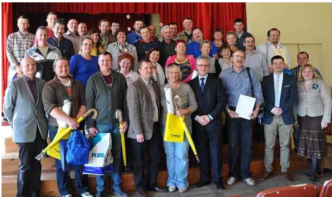
Konkursa žūrija un dalībnieki