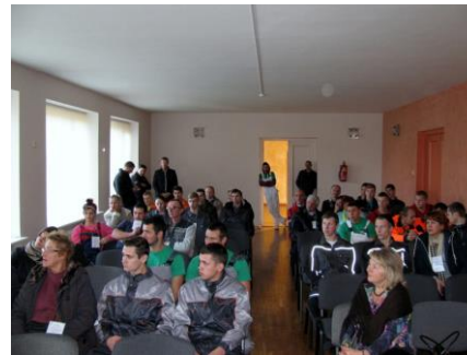
Vērtētāji: SIA „SAKRET”pārstāvji