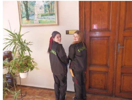
Zaļenieku komerciālās un amatniecības vidusskolas komanda

Profesionālās meistarības konkursā piedalījās 30 konkursanti no 15 Latvijas profesionālās izglītības iestādēm.