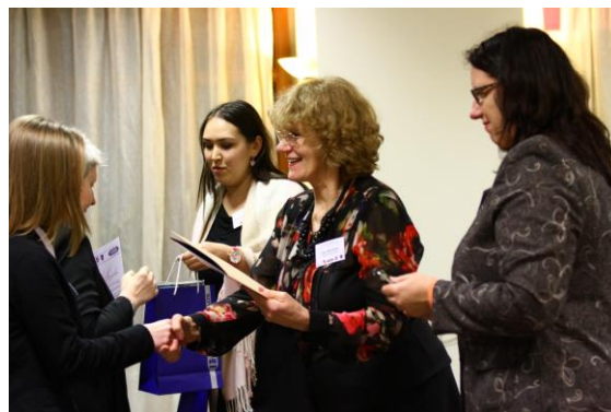
Apbalvošanas ceremonija-tiek pasniegti Ogres tehnikuma atzinības raksti un dāvanas