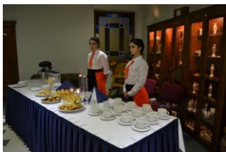
Sirsnīga konkursantu, pedagoģu un viesu sagaidīšana