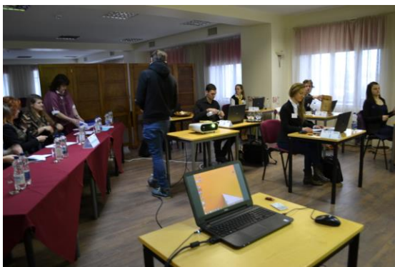
konkursanti gatavojas pirmā uzdevuma prezentācijai