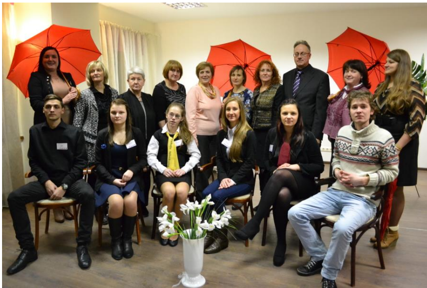
Tradicionālā „ģimenes” bilde-atmiņai par saturīgi kopā pavadītiem darba svētkiem Ogrē

Uz tikšanos citos konkursos un pasākumos!