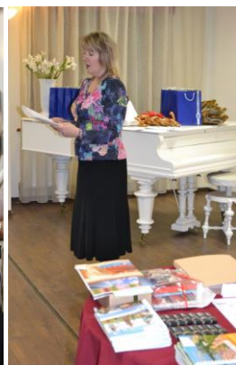
VISC pārstāve pateicas konkursa atbalstītājiem un pasniedz konkursantiem diplomus