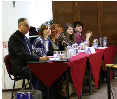
Vērtēšanas eksperti darba procesā

Konkursa vērtēšanas ekspertu komisijas dalībnieku prezentācija