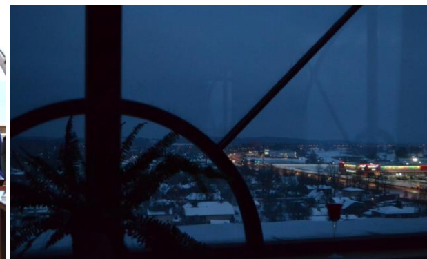
Semināra noslēgumā baudījām burvīgu naksnīgās Ogres panorāmu