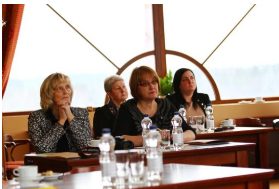
Ieskats pedagogu pilnveides seminārā viesnīcas „Club 1934” 9.stāvā