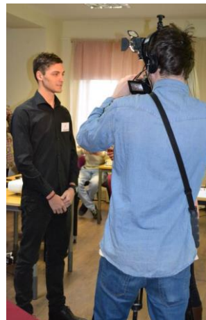
Par tūrisma nozares profesiju aktualitāti, konkursu, tā organizēšanu un norisi izrāda interesi Ogres televīzija