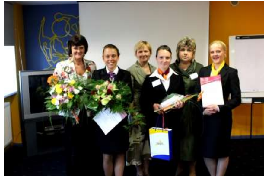
Konkursa uzvarētājas ar savām pedagoģēm