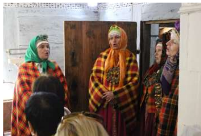
leskats pedagogu profesionālās pilnveides semināra norisē-„nepaklausīgākās” dalībnieces apdzied Suitu sievas