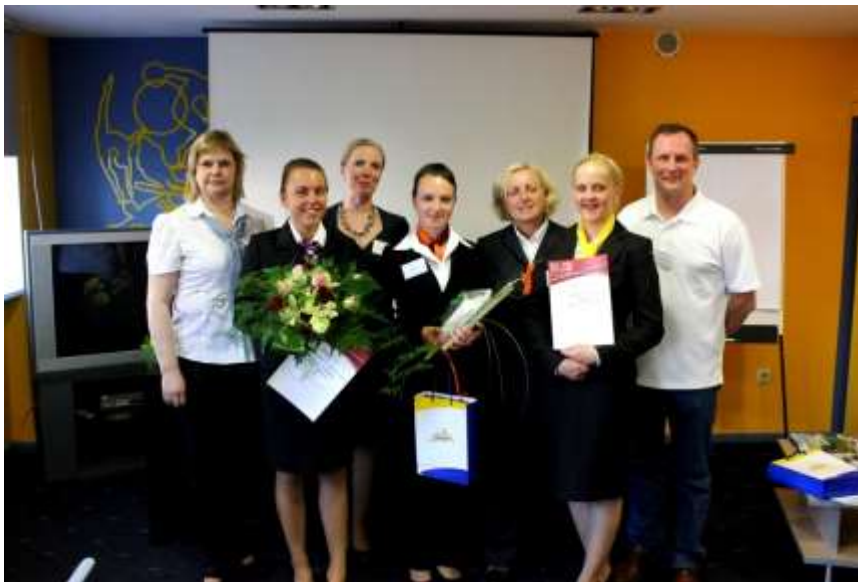
Konkursa uzvarētājas ar vērtēšanas komisiju