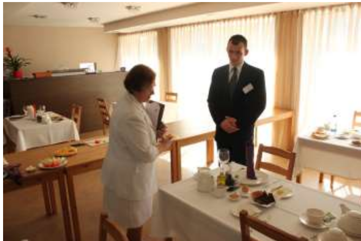
Galda klājuma vērtēšana