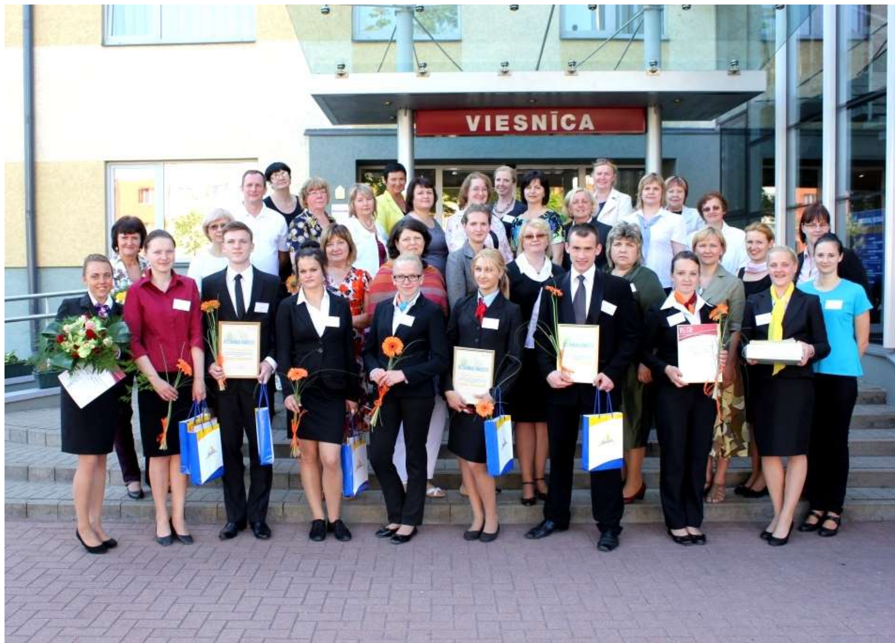
Visi kopā pēc konkursa