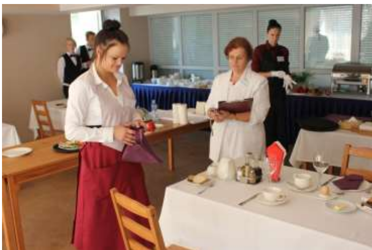
Brokastu galda klāšana