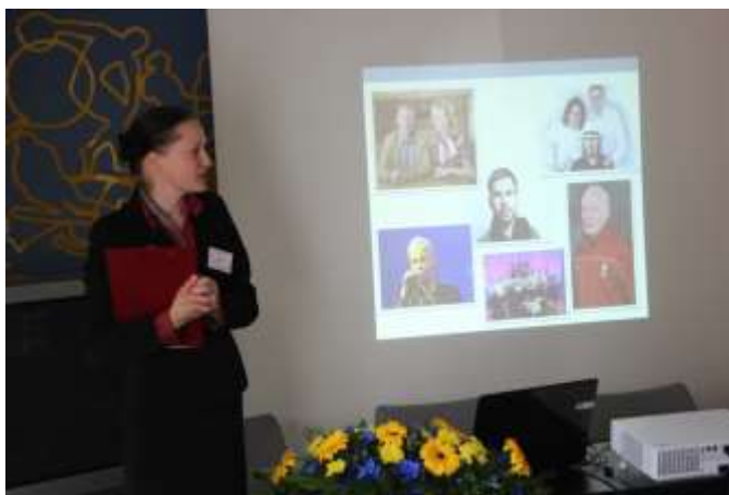
Prezentācija par savas pilsētas tūristu mītnes pakalpojumu piedāvājumu