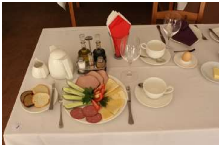
Brokastu galda klājums