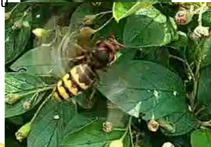
Sirsenis laukuma dzīvžogā