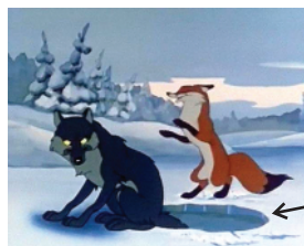
Āliņģis – caurums ledū.