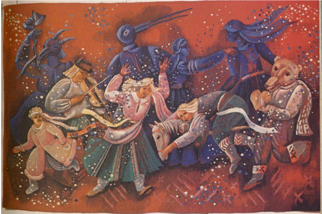
Lilita Postaža (1941). Ķekatas. 1983. Vilna, lins, gobelēns.