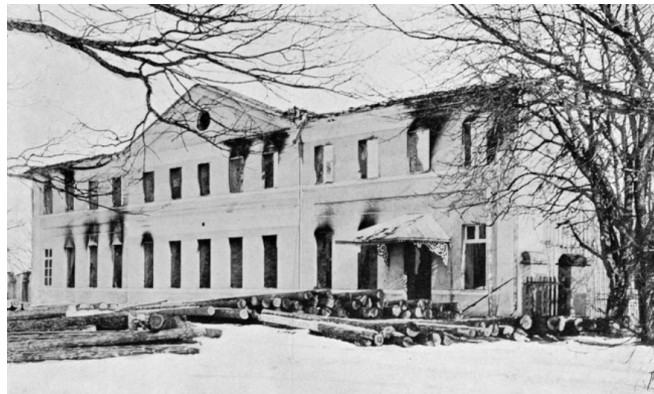
Litenes muižas ēka 1905. gadā

1905. gadā Latvijas teritorijā revolucionāri nodedzināja 449 muižas, pavisam zināmi ap 900 dedzināšanas gadījumi.