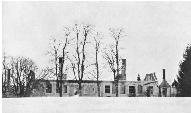
Vecbebru muižas ēka 1905. gadā