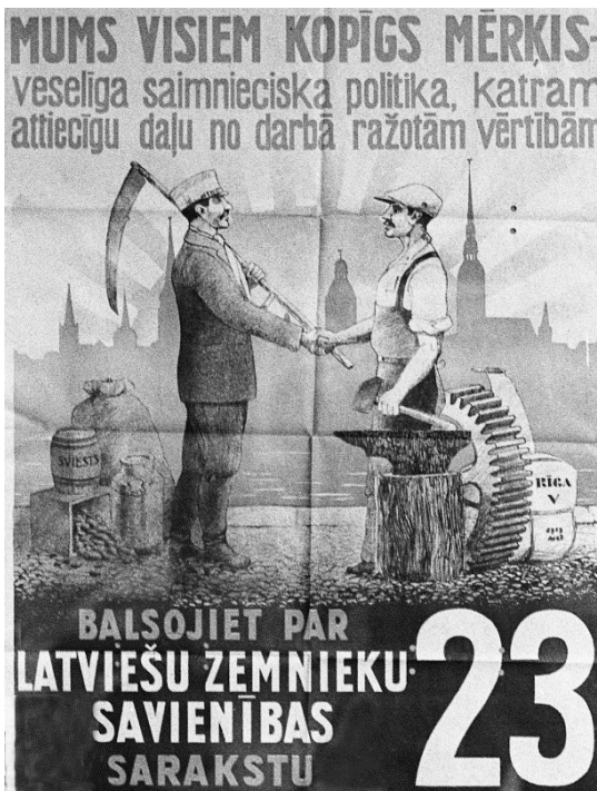
Latviešu zemnieku savienības vēlēšanu plakāts