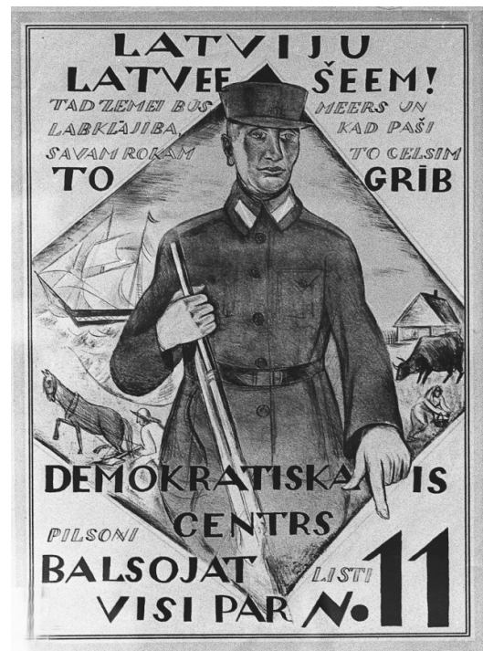
Demokrātiskā centra vēlēšanu plakāts