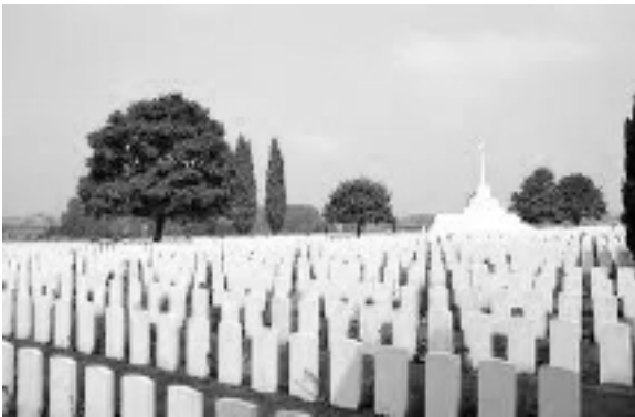
Pirmā pasaules kara karavīru kapsēta Flandrijā