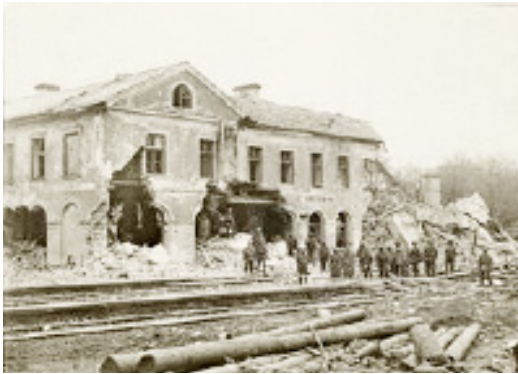
Sagrautā dzelzceļa stacijas ēka Skrīveros. 1917. gads