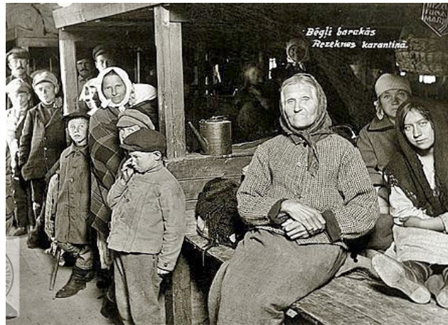
Bēgļu baraka Rēzeknē. 1920. gads