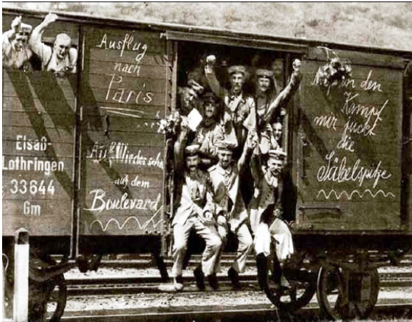
1914. gads – vācu karavīri dodas uz fronti. (Uzraksts uz vagona sienas: „Izbrauciens uz Parīzi”)