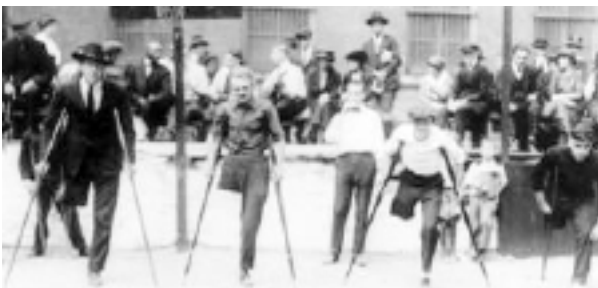
Bijušie Pirmā pasaules kara dalībnieki ASV, 1919.