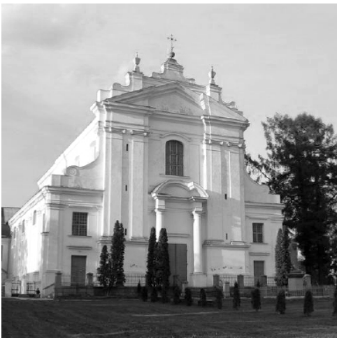
Sv. Ludvika Romas katoļu baznīca Krāslavā (Latgalē)