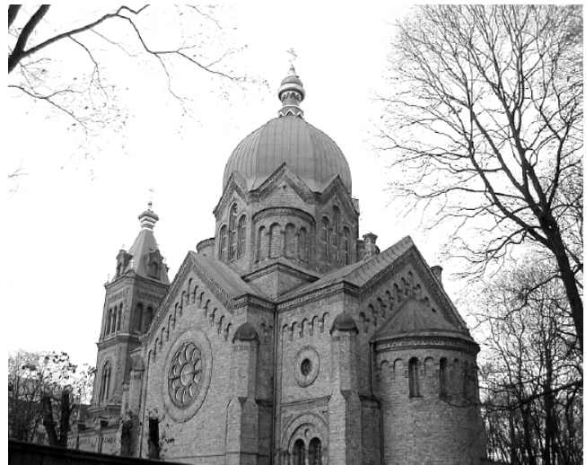
Visu Svēto pareizticīgā baznīca Rīgā (Vidzemē)