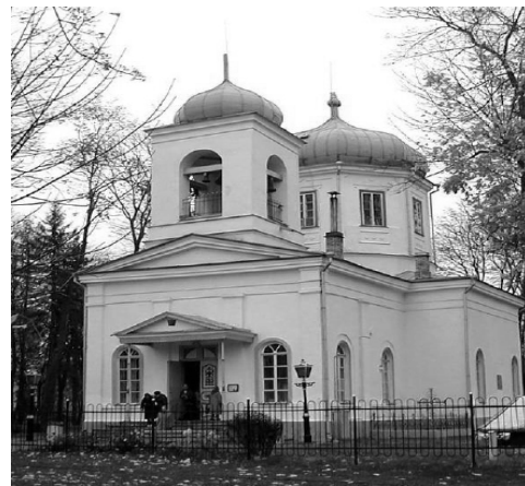
Rēzeknes Visssvētās Dievmātes piedzimšanas pareizticīgo baznīca (Latgalē)