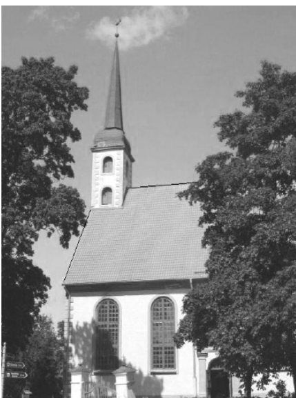
Sv. Jāņa luterāņu baznīca Limbažos (Vidzemē)