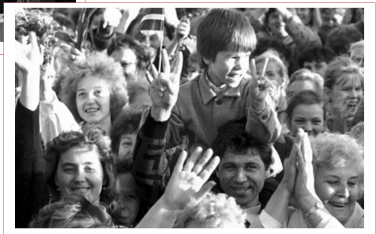
Cilvēki priecājas un ir laimīgi, 04.05.1990.