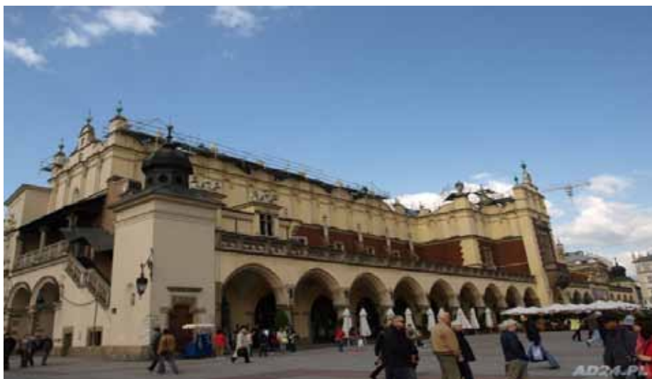
Sukiennice – budynek handlowy, w którym znajdują się kramy, sklepiki i stragany.

Tekst opracowany na podstawie W krainie ojców K. Harasimiuk i J. Rodzoś.