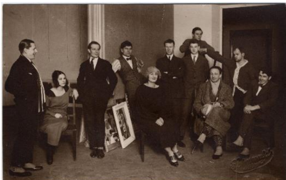
Skulmju dzimta 20. gadsimta 30. gados

Mācīties → viņš (viņa) mācīj-ās → viņš ir mācīj- ies / viņa ir mācīj- usies