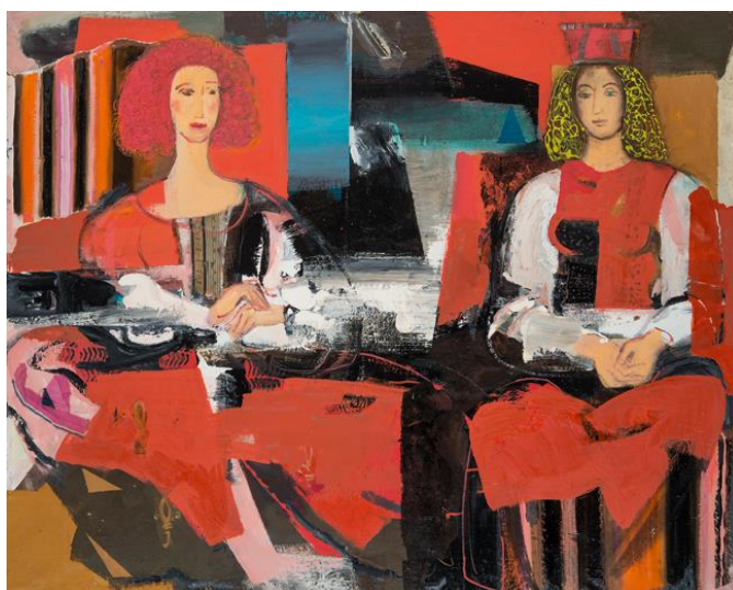
Džemmas Skulmes glezna „Dialogs”, 2000.