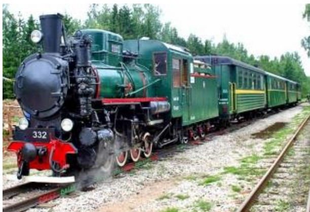
Alūksnes – Gulbenes bānītis

Ieraksti vietnes You tube meklētājā vārdus avārijas brigāde un skaties animācijas filmas “Avārijas brigāde”!