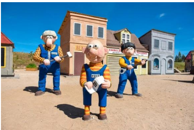
Izklaides parks „Avārijas brigāde”