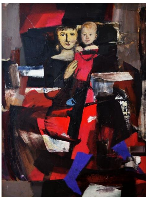
Džemmas Skulmes glezna „Marta un Jānītis”.