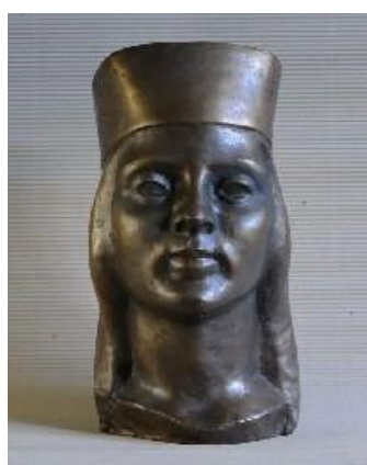
Martas Skulmes (Liepiņas) skulptūra „Vainagā” (1939).