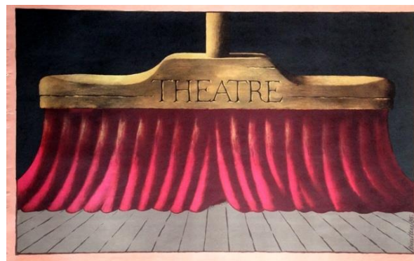
Jura Dimītera plakāts „Theatre” (1985).