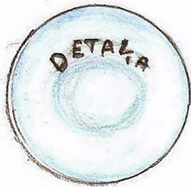
4. attēls. Detaļas žetons