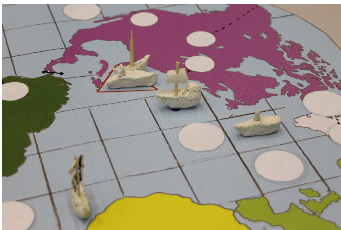
8. attēls. Spēles laukums un spēles kuģi