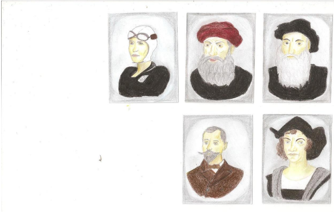
1. attēls. Ceļotāju kartiņas