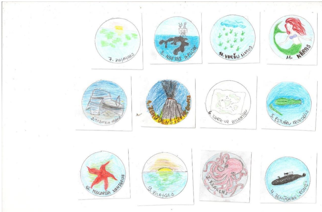
3. attēls. Spēles žetoni