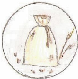
5. attēls. Pelavu maiss