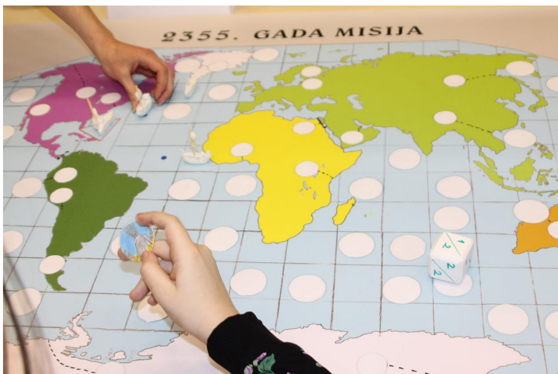
7. attēls. Spēles laukums