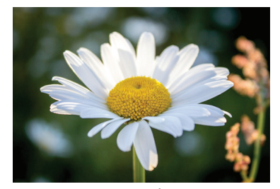
Parastā pīpene jeb margrietiņa