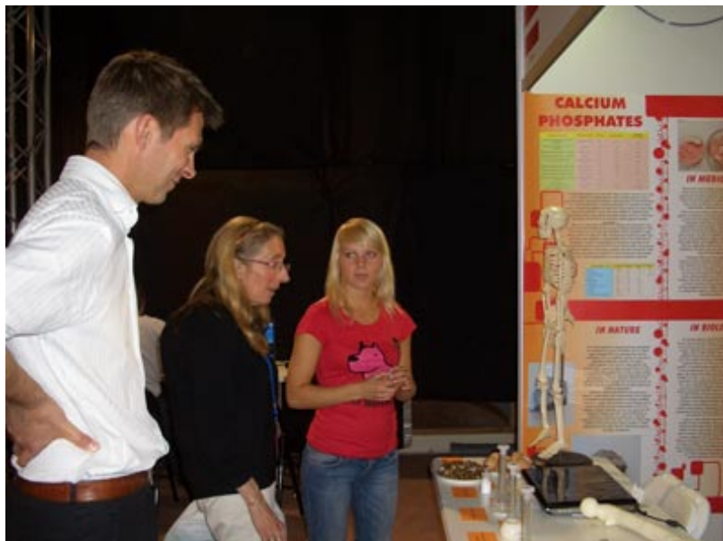
Izstādes apmeklētāji pie Evas Dručkas stenda